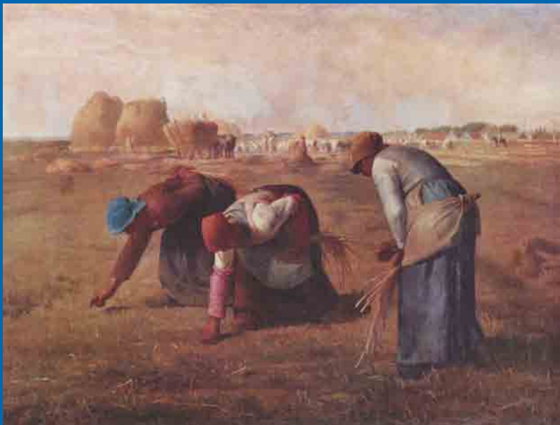
Jean-Francois Millet. Las espigadoras (1857)

Ante el desamparo que afecta a estos grupos, resaltó que “el estado mexicano tiene la obligación de promover los derechos fundamentales”, y para ello, debe reconfigurar sus políticas de desarrollo además de combatir la pobreza y la violencia.