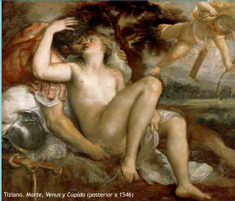
Tiziano. Marte, Venus y Cúpido (posterior a 1546)

Los celos irracionales están basados en pensamientos que no tienen fundamento. Aquí existe agresión física y psicológica; la persona celosa puede llegar a la violencia extrema. Sus pensa-