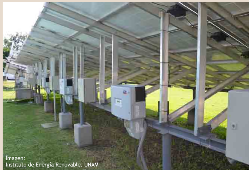
Imagen: Instituto de Energía Renovable. UNAM