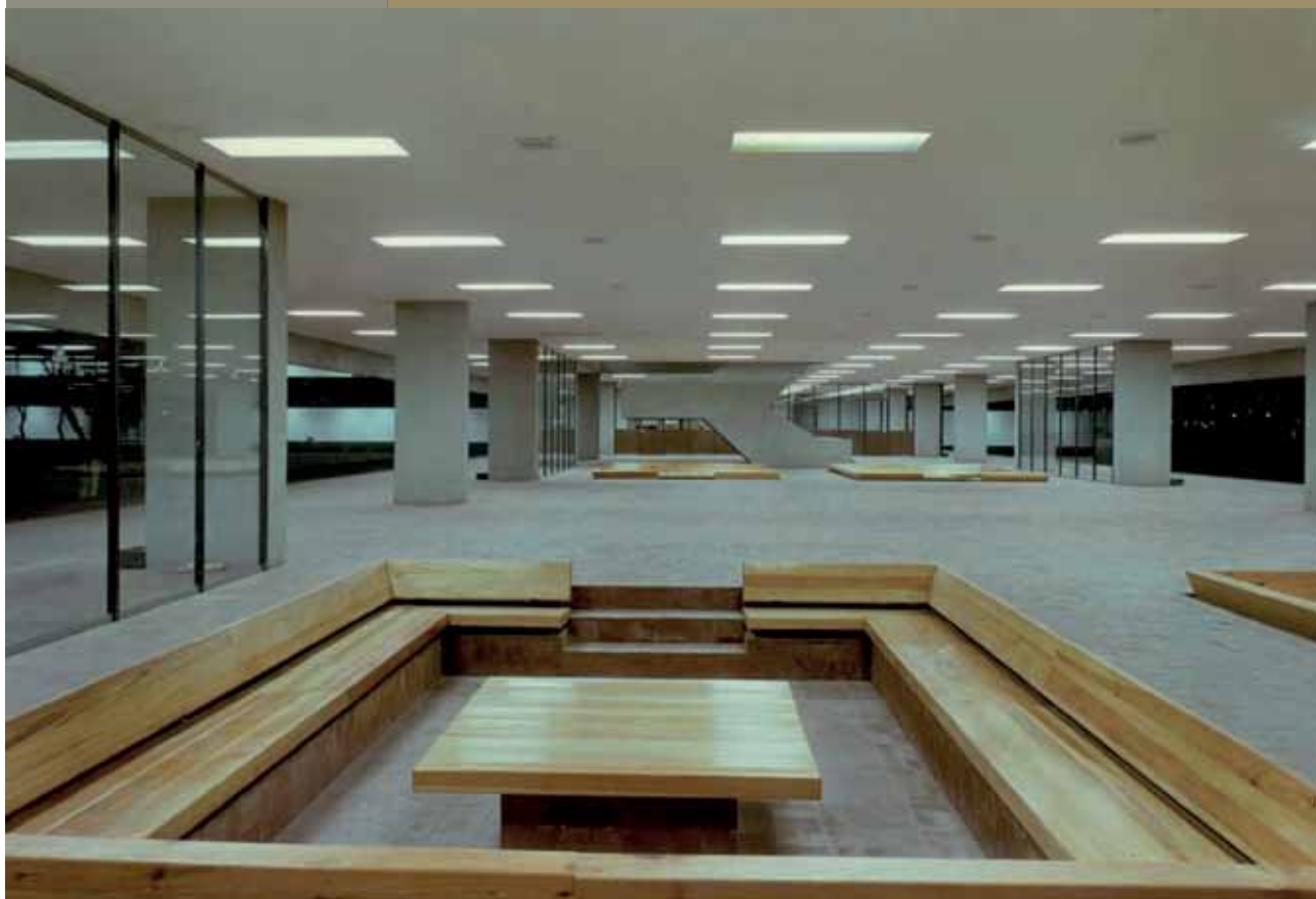
Imagen de las ágoras, espacio que fue sustituido por la Galería del Tiempo en 1999

Inauguración jueves 6 de febrero, 13:00 hrs.