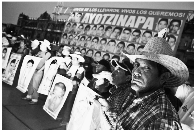
Dentro de los estudios de caso que se desarrollan en este texto no dejan de tener resonancia primigenia el problema de los 43 estudiantes de la Normal, Isidro Burgos de Ayotzinapa, Guerrero.

Construcción político-social que para la actual co-