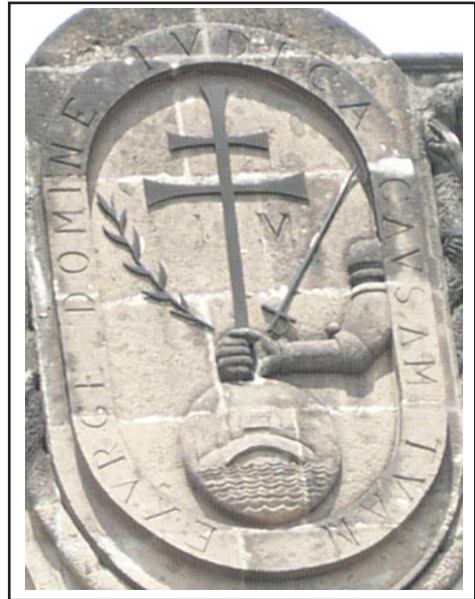
Escudo de la Santa Inquisición en México.

El día 30 de noviembre de 1539, Chichimecatecotl fue sacado de la cárcel del Santo Oficio, con un sambenito puesto, una coroza en la cabeza y una candela en la mano; con una cruz delante fue llevado al lugar donde sería ejecutado, en donde ya estaba preparado el cadalso y mucha gente reunida, entre la que se encontraban Antonio de Mendoza y Pacheco, Virrey y Gobernador de Nueva España, los Oidores de la Audiencia Real, y fray Juan de Zumárraga, Obispo e Inquisidor, quien después de predicar, mandó leer públicamente los errores, herejías y palabras heréticas de Chichimecatecotl, que se encontraban probadas, según Zumárraga, en el proceso y la sentencia que en ese momento se le notificó a Chichimecatecotl, quien dijo que la