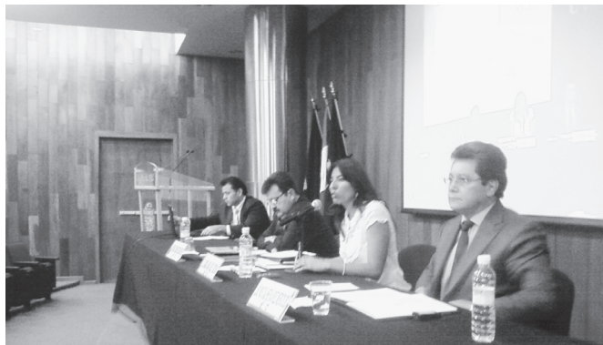
Archivo 1. MASC. Mesa

Por ello, hace falta abrazar una política sistémica que instaure y aliente procesos pedagógicos que provoquen el razonamiento, la construcción de conocimiento y opinión crítica, más allá de una Reforma Educativa 2013 o juegos políticos. Este llamado juego de tronos en la política al interior de la administración pública federal y universitaria, en muchos casos