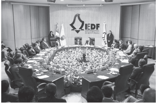
El Instituto Electoral del DF y el Instituto de Información del DF, constituyen nada más y nada menos, los órganos garantes del acceso a la información (con carácter autónomo, especializado e imparcial).

El Instituto Electoral del DF y el Instituto de Información del DF, constituyen nada más y nada menos, los órganos garantes del acceso a la información (con carácter autónomo, especializado e imparcial), que concurren desde ángulos distintos