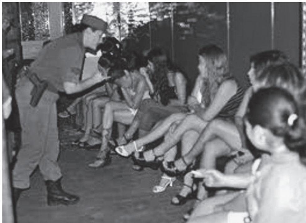
El gobierno y la sociedad en su conjunto deben crear dispositivos para hacer más efectiva la acción penal, en contra de la “trata de personas”

Es deber de las autoridades implementar mecanismos que respalden a las ONG'S, que se dedican a investigar y denunciar lo que sucede con los migrantes y la trata de personas, para dismantelar las bandas bien organizadas que se dedican a cometer estos delitos, así como erradicar la corrupción en todas las esferas de gobierno, para que no sigan protegiendo a los delincuentes, fundamentalmente a los de “cuello blanco”.