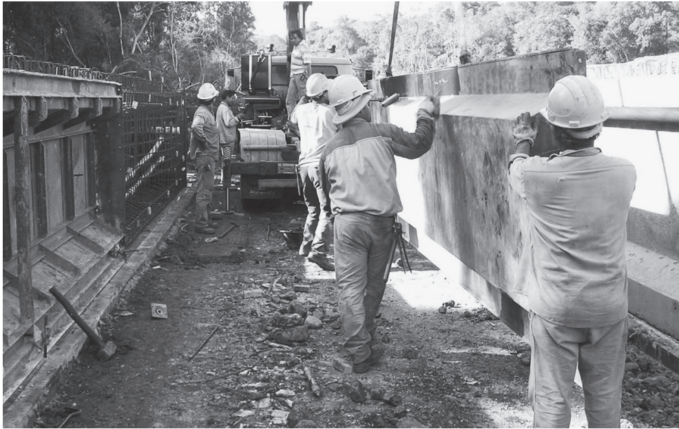
Los trabajadores que laboran en la industria de la construcción, tienen derecho al reparto de utilidades.

y postnatales, así como los trabajadores víctimas de un riesgo de trabajo durante el período de incapacidad temporal, sean consideradas como trabajadoras en servicio activo.