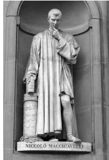
Hay una frontal contraposición de visiones acerca de la naturaleza humana entre Juan Jacobo Rousseau y Maquiavelo.

A continuación, procedo a desarrollar diversas reflexiones generales sobre algunos de los “principios políticos” o consejos políticos, que Maquiavelo escribió en De Principatibus , que he considerado relevantes para esta breve investigación.