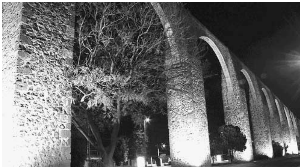
La ciudad de Querétaro forma parte de la “Ruta de la Libertad” en la celebración del Bicentenario.

nal y por la epidemia de influenza, esperemos que se trate de una cuestión puramente coyuntural.