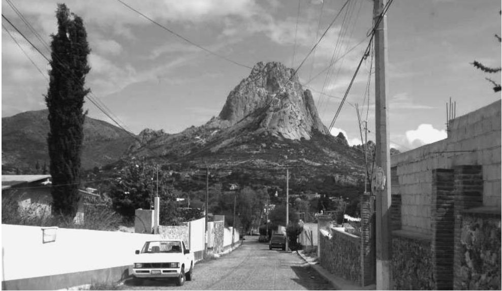
La publicidad oficial de Querétaro ostenta al estado como una "marca turística".

reunido a los representantes de los cuerpos constituidos bajo la dirección de la clase media, a través de los cabildos. Pero la conspiración de Querétaro es descubierta. En ese momento solo queda un recurso. La decisión la toma Hidalgo: la noche del 15 de septiembre, en la villa de Dolores, de la que es párroco, llama en su auxilio a todo el pueblo, libera a los presos y se hace de las armas de la pequeña guarnición local. El movimiento ha dado un vuelco. La insurrección ya no se restringe a los criollos letrados. A la voz del cura ilustrado, estalla súbitamente la cólera contenida de los oprimidos. La primera gran revolución popular de la América hispana se ha iniciado (Villoro, 1994: 613-14).