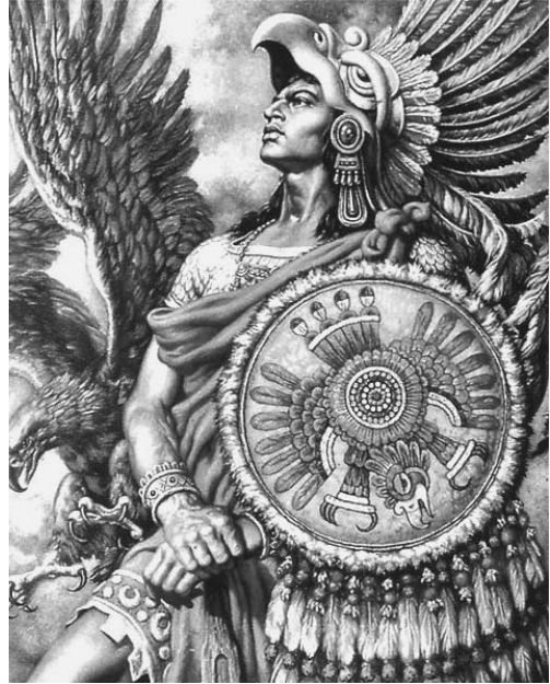
Tras la Independencia y después de la Revolución se crea y recrea la Nación Mexicana, La Identidad Nacional, el Patrimonio Nacional.

Si consideramos que en nuestro país existe una memoria sentimental histórica y geográfica, cultural y afectiva, por supuesto que imaginada e inventada en parte, pero no por ello menos real o emotiva. Si bien creada desde la cultura hegemónica y los núcleos de poder para consumo interno y cohesión social, entre otras intenciones, a las cuales se suma la imagen comercial encaminada a la actividad turística, pero no por ello, repetimos, menos querida y vívida en varios espacios y para algunos sectores.