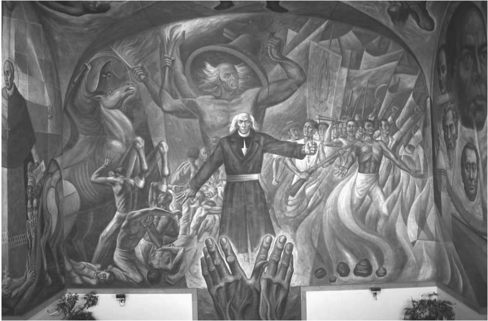
La insurrección de Independencia se manifiesta como un movimiento de masas y para los explotados era una emancipación en el más amplio sentido del término.

como asalariados, a importantes tipos de trabajadores como los arrieros y los artesanos urbanos”. 17