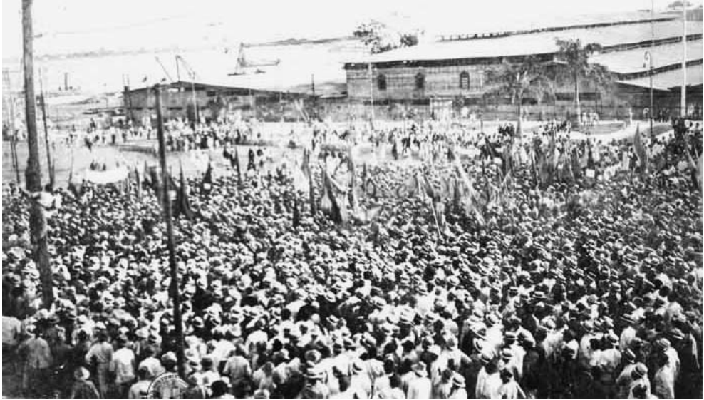
El sindicalismo mexicano se desarrollaba y cobró gran importancia, en contraste con la organización y el derecho sindical.

En dos vertientes fue armándose la estructura ideológica y de acción de las organizaciones sindicales: una, de notoria impronta oficialista, proclive y dócil hacia las consignas oficiales y otra de postura contrastante, que finalmente apuntó a una mística socializante, orientada al anarquismo. Así comenzó a gestarse el sindicalismo mexicano en busca de una función de resistencia y contraste con los intereses financieros por lo regular ligados al gobierno de los liberales.