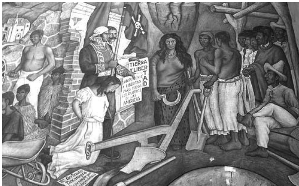
Morelos, por la posición que ocupaba disponía de una perspectiva privilegiada para percibir a fondo la tragedia de los explotados y la insolencia de los poderosos.

los mecanismos para su conformación; la división de los poderes, la asunción del voto como mecanismo válido para elegir, al mismo tiempo que se va delimitando el territorio al fragor de las controversias entre liberales monárquicos y liberales republicanos, así como la expansión imperialista sobre el territorio nacional.