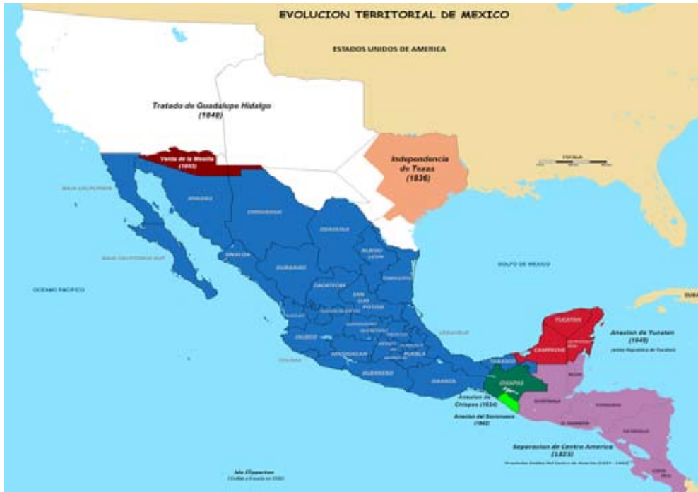
Mapa del territorio nacional al final de la Independencia.