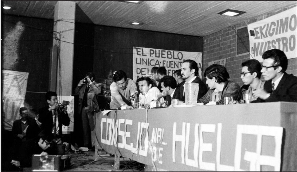
Mesa de debates en Sesión de Consejo Nacional de Huelga del Movimiento Estudiantil del 68.

nes provocadoras. En una primera reacción, el 24 de julio la Escuela Nacional de Ciencias Políticas, declara la huelga, en solidaridad con los estudiantes presos. La Federación Nacional de Estudiantes Técnicos (FNET) llama a una movilización el próximo 26 de julio.